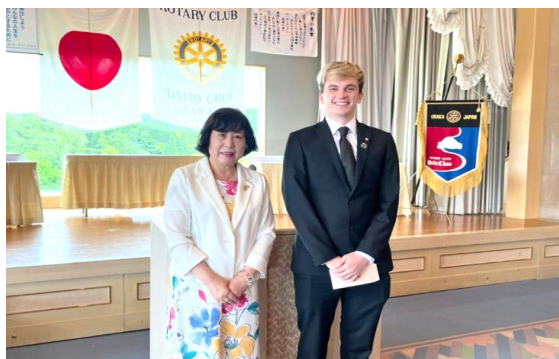
米山奨学生奨学金授与

I M第3組第4回新旧合同会長・幹事「燦々会」に白川会長エレクトと参加し、クラブ活動の概要報告と、大東RCとの合同例会の真偽の確認をしてきました。