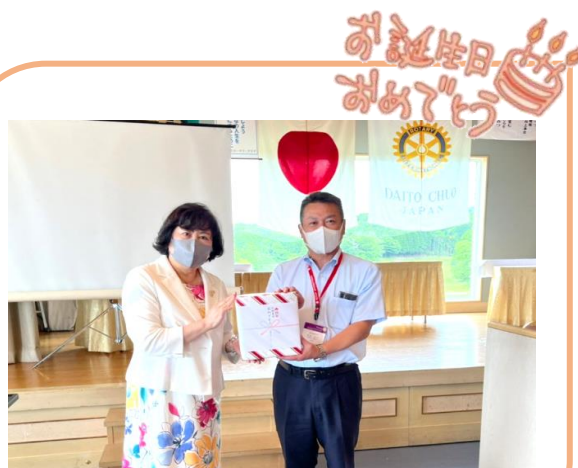
お誕生日おめでとうございます。