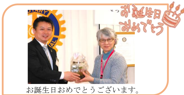
お誕生日おめでとうございます。